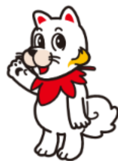
広島広域都市圏 マスコットキャラクター ひろしま都市犬はっしー